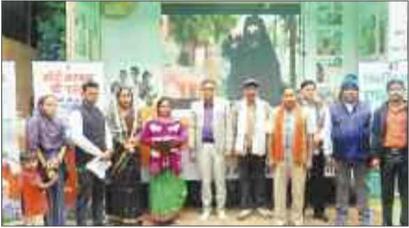
शिविर के दौरान उपस्थित अधिकारी एवं आम नागरिक।

विकसित भारत संकल्प यात्रा के तहत भारत सरकार की योजनाओं की जानकारी आम नागरिकों तक पहुंचाने एवं शासन की लोक हितैषी योजनाओं से लाभान्वित करने के उद्देश्य से जिले के सभी जनपदों के निर्धारित स्थानों में कार्यक्रमों का अनुसरण सतत रूप से शिविर का आयोजन किया जा रहा है। इसी कड़ी में आज विकासखंड कटघोरा के ग्राम सिंधाली व विजयपुर में, जनपद पंचायत करतला के भेलवागुड़ी, सीधापाठ व