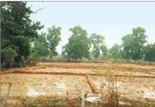
रबी के फसल की तैयारी में तैयार होने लगे खेत।