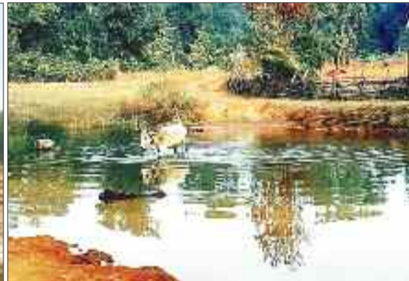
रजगामार बांध का बाघमाड़ा जलाशय।